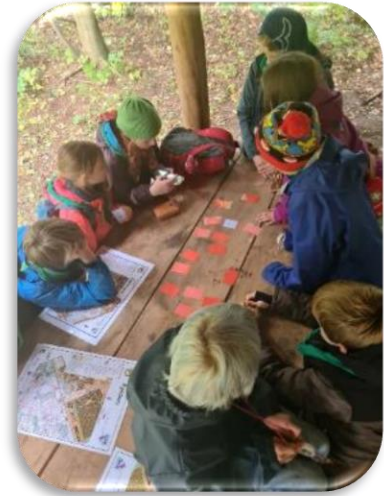
Vendespil med kortsignaturer