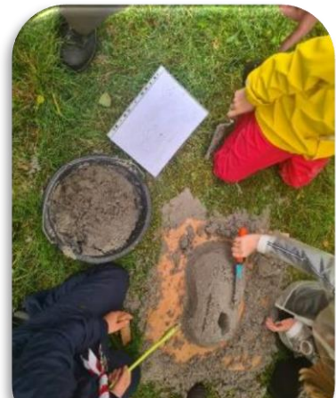
Der bygges sandskulpturer efter tegning med højdekurver